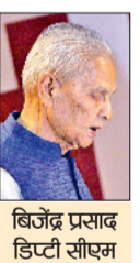
बिजेन्द्र प्रसाद डिप्टी सीएम

सुबह 11 बजे उन्हें पद और गोपनीयता की शपथ दिलाई। बिहार की नई सरकार में जदयू से विजय चौधरी और बिजेन्द्र यादव ने भी शपथ ली। दोनों को डिप्टी मुख्यमंत्री बनाया गया है। नीतीश कुमार इस कार्यक्रम में मौजूद थे। बिहार में अभी मंत्रिमंडल का ऐलान नहीं किया गया है। सम्राट चौधरी के पास गृह समेत 29 विभाग