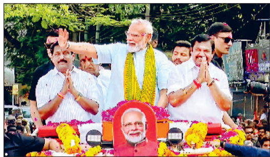
योग और मोटे अनाज समेत 9 संकल्प अपनाने की अपील

मॉड्य (कन्याकुमारी) (भाषा)। प्रधानमंत्री मोदी ने बुधवार को लोगों से विकसित कर्नाटक और विकसित भारत के लक्ष्य को हरित करने के लिए जल संरक्षण, प्राकृतिक खेती, फिटनेस और जैविक खेती को बढ़ावा देने, पर्यटन को प्रोत्साहित करने, रसायन मुक्त प्राकृतिक खेती अपनाने, मोटे अनाज के साथ स्वस्थ भोजन करने और तेल के कम उपयोग को बढ़ावा देने की अपील की। उन्होंने मॉड्य स्थित आदित्यनगरि महारक्षणा मठ में समा को संबोधित करते हुए कहा कि यदि हम इन नौ संकल्पों पर ईमानदारी और दृढ़ संकल्प के साथ आगे बढ़ें, तो हम तेजी से विकसित कर्नाटक और विकसित भारत की दिशा में प्रगति कर सकते हैं।