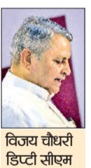
विजय चौधरी डिप्टी सीएम