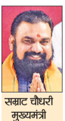
सम्राट चौधरी मुख्यमंत्री

उन्होंने ईश्वर के नाम पर शपथ ली। राज्यपाल सैयद अता हसनैन ने लोकभवन में सुबह 11 बजे उन्हें पद और गोपनीयता की शपथ