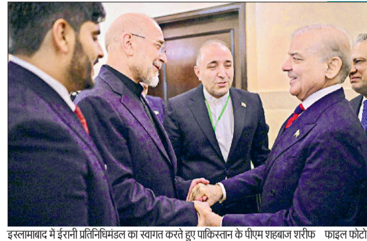
इस्लामाबाद में इरानी प्रतिनिधिमंडल का स्वागत करते हुए पाकिस्तान के पीएम शहबाज शरीफ फाइल फोटो

इरानी प्रतिनिधिमंडल ने विमान बदला था बस और ट्रेन से पहुंचे थे तेहरान इरान का अमेरिका पर भरोसा नहीं, वो धोखेबाज, हम सैन्य तैयारियों में जुटे